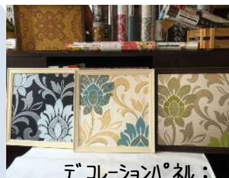
デコレーションパネル： ¥3,240 7/27(木)

-8月スケジュール- 8/2(水)スツール、テーブル 8/5(土)夏休みDIYイベント 8/6(日)輸入壁紙貼り方教室 8/19(土)デコレーションパネル 8/28(月)輸入壁紙貼り方教室