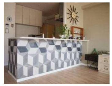
カウンターの下に貼ってアクセントに♪

色々な場所で壁紙を使っちゃいましょう！ 選ぶ柄は人それぞれ♪アイデアもひとそれぞれ！