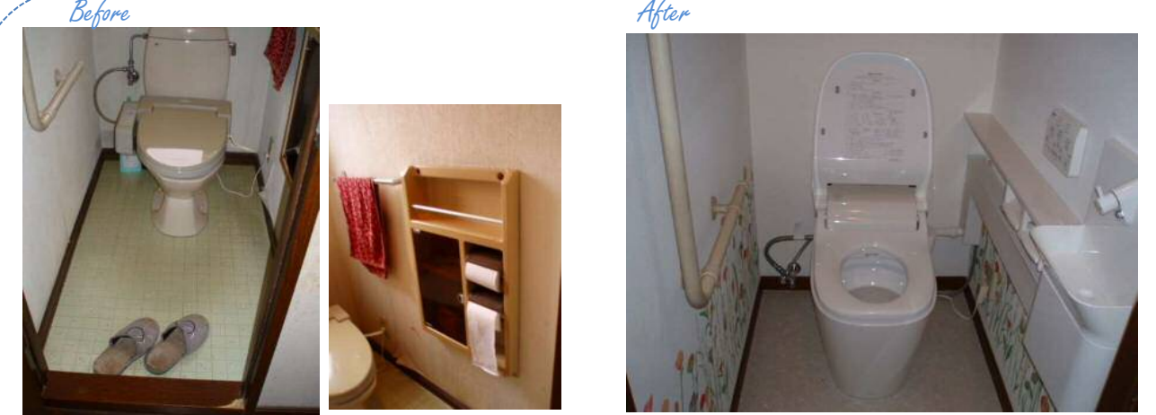
タンク付の水栓トイレから、パナソニックの「アウナス」へ取替されました。アウナスはタンク入の為手洗いがありませんので、一体型の手洗い器付きへリフォーム。壁紙は、消臭機能があるルノンの「空気を洗う壁紙」をお勧めしました。工期1日 基山町 A様邸

現在お使いのトイレが1965年製のC150Eだとしたら、一回の使用水量3.6Lに取り替えるだけで最大16.2Lの節水、金額にして年間最大¥31,210もお得です (toto資料)。きれい、明るい、トイレリフォーム、ご検討されませんか？