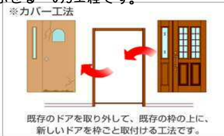
既存のドアを取り外して、既存の枠の上に、新しいドアを枠ごと取付ける工法です。

リフォーム用玄関ドアの工事の基本は、 【1】古いドアと不要な部品の取り外し、 【2】新しい枠とドア取り付け、 【3】古い枠の上から額縁をかぶせる の3工程です。 途中に、方立と呼ばれる建枠の切り取りやサイズ調整、金物の取り付け調整などありますが、だいたい1日で終わります。