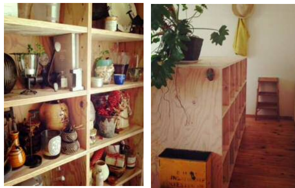
※写真は、スタイリスト佐々木カナコ様宅 北欧暮らしの道具店コラムより